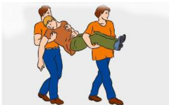
Необходимо перенести человека в тень