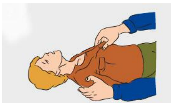
Уложить пострадавшего и ослабить одежду: ремень, галстук и т.д.