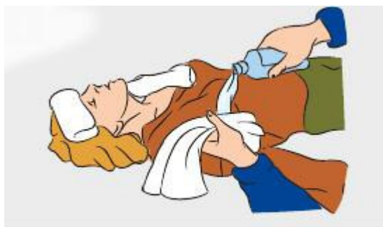
Положить на тело смоченные холодной водой полотенца

8. Вода необходима и для внутреннего охлаждения. Для этого ее надо подсолить и пить не сразу, а в несколько приемов. Объем примерно 1 литр.